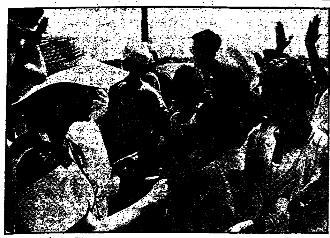
عقيلة الرئيس اوفيرا ناسون تصافح اهالي القبرى في اعالي الصعيد المصري .